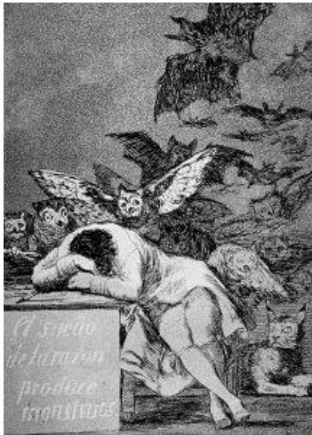
Figura 3. Grabado n° 43 de los Caprichos, «El sueño de la razón produce monstruos» (1797-1799). Autor: Francisco de Goya.